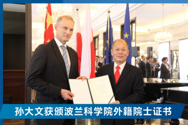
孙大文获颁波兰科学院外籍院士证书

多项国际大奖；主持国家自然科学基金、国家国际科技合作专项等科技项目多项；荣获 2014 年度广东省科学技术奖一等奖、2018 年度广东省科技进步奖一等奖等多项奖励；授权中国及美英日等发明专利 70 多件；在世界著名杂志和国际会议上发表了 1000 篇论文，出版专著 17 部，共有 700 多篇论文被 SCI 收录；2015 年至 2022 年连续八年荣获科睿唯安全球“高被引科学家”称号。